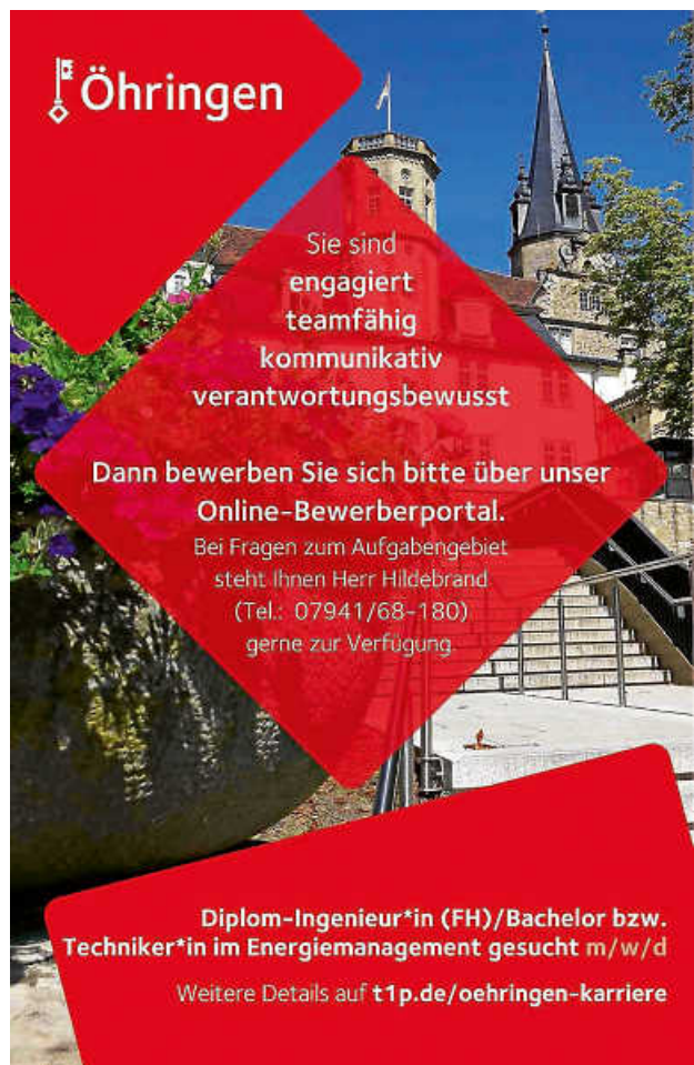
Stellenanzeige Energiemanagement