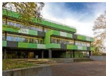
Die Realschule Öhringen - eine Realschule mit bilingualem Zug

Für Eltern mit einem Schulkind der vierten Klasse steht in diesen Wochen eine wichtige Entscheidung an: die Wahl der weiterführenden Schule. Sie fragen sich: Welche Schulart passt zu meinem Kind? Welche Schule ist die richtige?