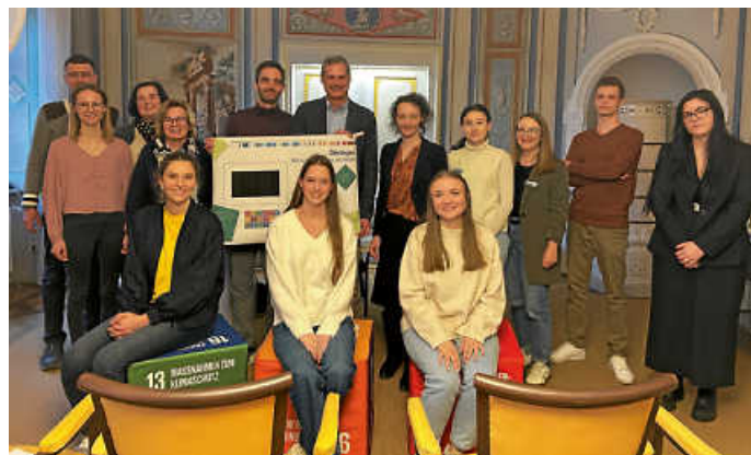
Auszubildende machen sich für den Klimaschutz stark: Als Kommunale KlimaScouts haben sie tolle Ideen entwickelt und umgesetzt

Das Projekt „Kommunale KlimaScouts“ verbindet die Ausbildung im kommunalen Bereich mit dem Thema Klimaschutz. An diesem inspirierenden Programm beteiligten sich im vergangenen Jahr Auszubildende aus den Landratsämtern des Landkreises Schwäbisch Hall und des Hohenlohekreises sowie aus den Verwaltungen Hohenloher Städte und Gemeinden. In Teams entwickelten sie innovative Lösungen für den Klimaschutz. Kürzlich feierten Sie im Landschaftszimmer des Öhringer Rathauses das Siegerprojekt 2024.