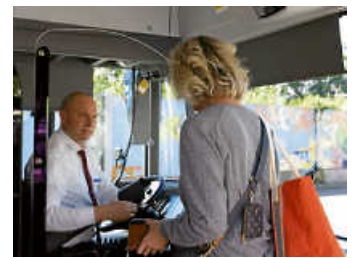
Die Ausschreibung der neuen Landesehrung BWegerinnen und BWeger ist gestartet. Gesucht werden besonders kompetente und freundliche Mitarbeitende im Nah- und Regionalverkehr