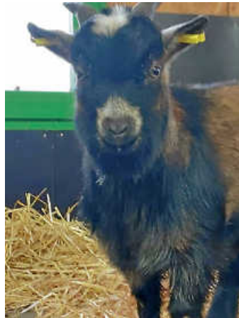
Kiano, das neue Afrikanische Zwergziegenböckchen im Tier- gehege Öhringen, bringt frischen Wind in die Ziegen-WG. Über 700 Menschen wählten seinen Namen per Online-Abstimmung

Der neue Bewohner des Tier- geheges Öhringen hat einen Namen: Das junge Afrikani- sche Zwergziegenböckchen heißt ab sofort „Kiano“. In einer Online-Abstimmung auf den Social-Media-Kanälen der Stadt Öhringen nahmen über 700 Menschen teil. Mit einer klaren Mehrheit von 67 Pro- zent setzte sich „Kiano“ gegen den zweiten Vorschlag „Jamal“ durch. „Kiano“, was „Frischer Wind“ bedeutet, passt perfekt zum lebhaften Charakter des sechs Monate alten Ziegen- böckchens, das aus dem kleinen Zoo Nymphaea in Esslingen nach Öhringen gekommen ist. Mit seiner fröhlichen Art bringt er Schwung in die bestehende Zwergziegen-WG, die bisher ausschließlich aus weiblichen Tieren bestand.