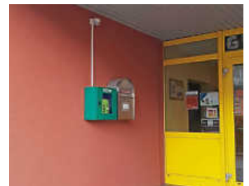
Der Cappel Defibrillator hängt nun an der ehemaligen Grundschule Cappel

Mit dem Wegfall des Dorfgemeinschaftshauses in der Cappel Bachstraße hat sich auch der Standort des dort aufgehängten Defibrillators verändert. Dieser befindet sich nun im Eingangsbereich der ehemaligen Grundschule Cappel in der Schulstraße 6 und ist rund um die Uhr öffentlich zugänglich. Das lebensrettende Gerät soll in Notfällen für schnelle Hilfe sorgen und steht jedem zur Verfügung.