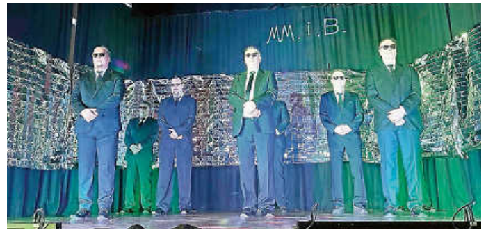
Männlich in Black

Die Veranstaltung begann mit einem fulminanten Auftritt der Männerturngruppe „Männlich in Black“, die mit viel Humor ein grünes Alien jagten.