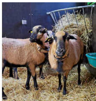
Nicky, Luna und Anne wohnen seit dem 3. Februar im Öhringer Tiergehege

Seit dem 3. Februar gibt es im Tiergehege Öhringen drei neue Bewohnerinnen: Die Ka- merunschafe Nicky, Luna und Anne erkundeten an diesem Tag zum ersten Mal ihr Außen- gehege. Die drei weiblichen Schafe stammen aus der Re- gion und gesellen sich nun zu Oscar, dem Bock, der bereits seit der Landesgartenschau im Tiergehege lebt.