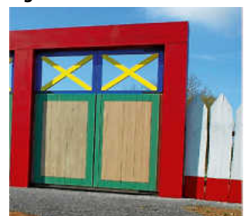
Limes-Tor Haller Straße

16 Uhr zum Osterzinngießen ein. Familien können gemeinsam Zinn-Hasen und Osterdekorationen gestalten und im Museums-