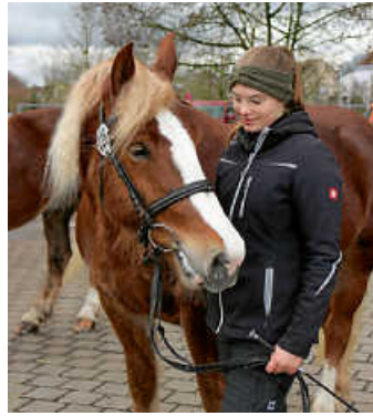
Perfekte Harmonie: Beim Öhringer Pferdemarkt erleben Besucher das besondere Zusammenspiel von Mensch und Tier hautnah

Wenn der Duft von Zuckerwatte in der Luft liegt, das Klappern der Pferdehufe die Öhringer Straßen erhellt und sich die historische Innenstadt in ein buntes Meer aus Marktständen verwandelt, dann steht der legendäre Öhringer Pferdemarkt vor der Tür! Am Sonntag, 16. Februar, und Montag, 17. Februar, erwartet die Besucherinnen und Besucher eine Mischung aus Tradition, Action und Genuss, die ihresgleichen sucht.