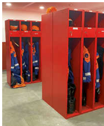
Jugendfeuerwehr: Umzug aus dem Keller in die neuen Räumlichkeiten