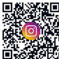
QR-Codes zu den Social Media Kanälen des Landratsamtes

Zwei Mitarbeiterinnen bearbeiten die Profile von „meinHohenlohekreis“, erstellen Beiträge, suchen nach Ideen, drehen und schneiden Videos und Reels, beantworten Anfragen und Kommentare. Regelmäßig gibt es auf dem Profil Gewinnspiele, die ebenfalls durch die Mitarbeiterinnen geplant und durchgeführt werden.