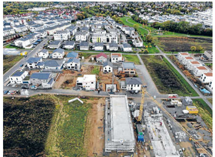
Eine der elf Maßnahmen zur klimaneutralen Wärmeerzeugung ist der verpflichtende Anschluss an Fernwärme im Limespark C und E

Der Wärmeplan ist informell und dient als strategische Grundlage für die Wärmewende. Das Projekt startete im April 2022 und ist bereits weit fortgeschritten. Bis Ende dieses Jahres muss es abgeschlossen sein. Mit dem Beschluss des kommunalen Wärmeplans ist noch kein verbindlicher Ausbau des Fernwärmenetzes in Öhringen eingeleitet.