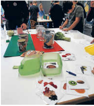
Aktion gegen Müll