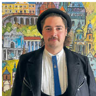
Handwerksgeselle auf der Walz

Die Laterne vor der Haustür ist dunkel? Gerade in der dunklen Jahreszeit ist es wichtig, dass die Straßenbeleuchtung funktioniert. Trotz regelmäßiger Überprüfungen kann es dazu kommen, dass die Lichttechnik nicht einwandfrei funktioniert. Aktuell ist bei der Stadt Öhringen zudem die Stelle als Elektriker*in ausgeschrieben, sodass nicht in der erwarteten Schnelligkeit gearbeitet werden kann. Wir bitten um ihr Verständnis.