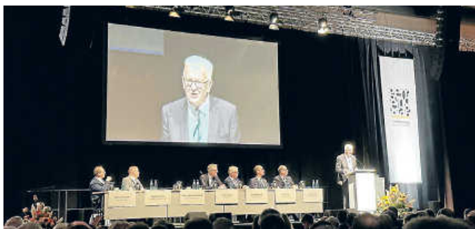
Ministerpräsident Winfried Kretschmann sprach ebenfalls bei der Veranstaltung zu „50 Jahre Gemeindetag Baden-Württemberg“