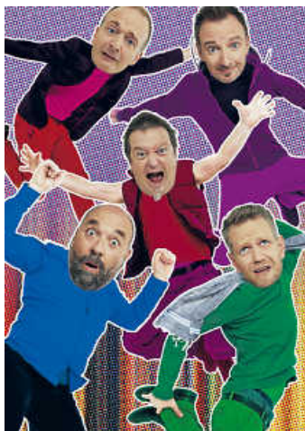
FÜENF - Endlich! Best of!