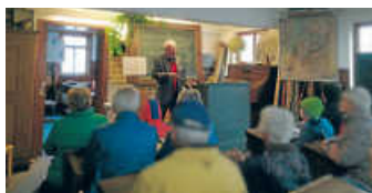
Erinnerungen an die alte Schulzeit wurden wach ...

Mädchen bekamen Handarbeitsunterricht durch „das Fräulein Lehrerin“, die entlassen wurde, wenn sie heiratete.