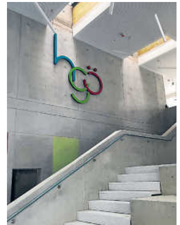
Innenansicht vom Treppenhaus des HGÖ-Neubaus, das als Veranstaltungsräum und zentraler Treffpunkt dienen wird

Im Januar 2021 war offizieller Baubeginn am HGÖ. Die Grundsteinlegung folgte am 28.04.2021, am 12.07.2022 war Richtfest. Startschuss für die Nutzung des Neubaus sollte zum Schuljahr 2023/24 sein. Nun verschiebt sich der Eröffnungstermin auf April 2024. Grund dafür ist Personalmangel bei der Trockenbaufirma. „Über 500 Schriftverkehre sind dazu ausgetauscht worden“, sagt Oberbürgermeister Thilo Michler. „Am Schluss blieb uns wegen Nichterfüllung der Leistung nur übrig, der Firma zu kündigen und neu auszuschreiben.“