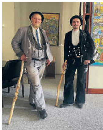
Mit einem Stab, ein paar Wechsel- und Arbeitsklamotten und einem Schlafsack im Gepäck reisen Handwerksgesellen auf der Walz von Ort zu Ort - auch nach Öhringen