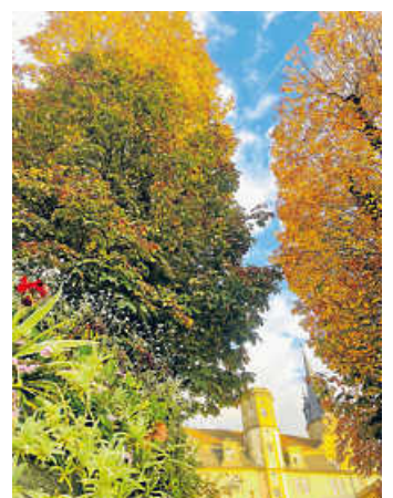
Arbeiten in der schönen Öhringer Natur: Gärtner*in gesucht

Im Rahmen der Verkehrssicherungspflicht werden alle Bäume auf städtischen Grundstücken in regelmäßigen Abständen kontrolliert. Aus den hierbei festgestellten Mängeln werden Maßnahmen abgeleitet, die nach Wichtigkeit priorisiert und mit eigenem Personal abgearbeitet werden. Der aktuelle personelle Engpass in der gärtnerischen Abteilung des Baubetriebshofes macht es mittlerweile erforderlich, die dringlichsten Pflegemaßnahmen extern zu vergeben. Nur so können haftungsrechtliche Ansprüche Dritter verhindert und die Verkehrssicherheit erhalten werden. Für die im Kontrollzeitraum Dezember 2022 bis Sommer 2023 festgestellten Mängel wurden an ungefähr 350 Bäumen verschiedene Maßnahmen definiert und in einem Leistungsverzeichnis zusammengefasst. Das kontrollierte Gebiet – Bezirk 0.02 – umfasst die Bereiche rund um den Verrenberger Weg, Sichert, Westallee, Dresdener Straße sowie den Friedhof. Nach Ausschreibung wurden die Arbeiten in der Gemeinderatsitzung am 24.10. an die Fa. Holzwarth Baumpflege & Gartengestaltung GmbH aus Althütte für 85.096,90 Euro vergeben.