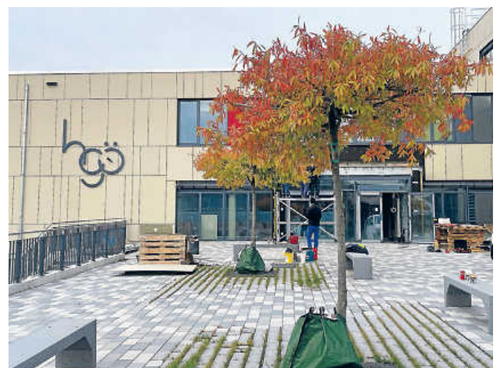
Von außen schon fertig: Eingang an der Ostseite

Nach den Querelen mit der Baufirma legten OB Thilo Michler, HGÖ-Schulleiter Frank Schuhmacher und Bauverantwortliche nun den neuen Zeitplan für die HGÖ-Baustelle fest. Am 5. April 2024 soll der Neubau fertig sein. In den Osterferien findet der Umzug vom C-Bau in den Neubau statt, sodass der erste Schultag am 8. April bereits in den neuen Räumen stattfinden kann. Danach beginnt die Sanierung vom C-Bau. Sie soll bis Ende 2025 laufen. Der Abbruch vom A-Bau folgt voraussichtlich im Sommer 2026. Der B-Bau wird zudem mit kleineren Umbaumaßnahmen vor