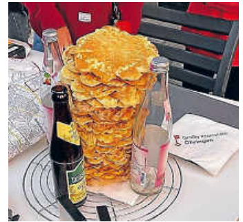
Der legendäre Waffelturm

Die Jupa-Küche unterstützte den Blutzuckerspiegel bei der herausfordernden Challenge mit selbst gebackenen Waffeln. Dabei musste auch ein 30 Zentimeter hoher Waffelturm hergestellt werden. Jeder erfolgreich gemeisterte Challenge wurde mit Punkten honoriert, die online übermittelt wurden. Die Auswertung erfolgte durch die Jury des Kreisjugendreferats. Hurra! Der erste Platz ging ans Jupa-Team aus Öhringen. Auf Platz zwei und drei folgten Waldenburg und Kupferzell. Herzlichen Glückwunsch!