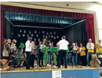
Die Dschungelbewohner spielen der Oma ein Geburtstagsständchen

Am 22. Oktober 2023 fand das Familienkonzert des Musikvereins Ohrberg statt. Unter dem Thema „Welches Instrument passt zu mir“ lud der MV Ohrberg die ganze Familie in die Turnhalle Ohrberg ein. Das Familienkonzert begann mit einem Beitrag der musikalischen Früherziehung und der Flötengruppe des Vereins. Danach folgte das musikalische Theaterstück „Ferdinand