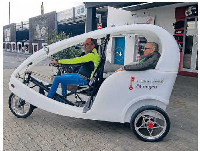
Wieder den Wind durch die Haare wehen lassen – mit der E-Rikscha des Stadtseniorenrates

Fahrtzeit ca. 30 Minuten durch den Hofgarten oder die Cappel- aue. Anmeldung bei Gerd Jungk, Montag - Freitag 10 -12 Uhr, Mobilnummer 0173/96 99 372. Startplätze beim Parkplatz an der Alten Turnhalle oder nach Vereinbarung. Die ehrenamtlichen Fahrer freuen sich über eine Spende. Der Stadtseniorenrat und die Rikschapiloten wünschen gute Fahrt!