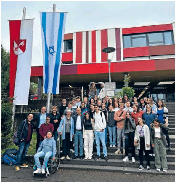
Gruppenfoto mit den israelischen Gastschülern bei ihrem letzten Besuch in Öhringen

Das Bild des Gastgeschenks aus Israel und das Gruppenfoto mit den israelischen Gastschülern entstanden vor 5 Monaten, steht symbolisch für den Wunsch nach einer besseren Zukunft." Frank Schuhmacher, Schulleiter