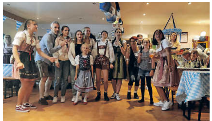
Karaoke-singen im Tennisverein der TSG Hohenlohe