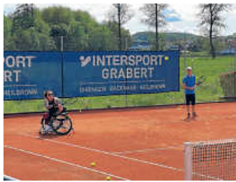
Rollstuhltennis auf der Anlage der TSG Hohenlohe in Öhringen

Jeder ist herzlich willkommen und dazu eingeladen ein Teil von etwas Wunderbarem zu werden. Wir möchten eine gemischte inklusive Tennisgruppe entstehen lassen, welche Rollstuhltennis & Fußgängertennis vereint und bei der man sich ganz frei und mit viel Spaß regelmäßig für 2 Stunden Tennis trifft. Unser Gedanke: Menschen mit und ohne Handicap spielen gemeinsam Tennis.