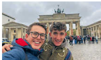
Der obligatorische Besuch am Brandenburger Tor