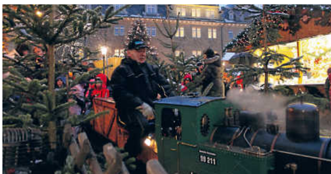
Auch das beliebte Dampfbähnle dreht auf dem Weihnachtsmarkt seine Runden

Das beliebte Dampfbähnle dreht gemütlich auf dem Marktplatz seine Runden. Der prächtige Weihnachtsbaum mit Krippe und festlich dekorierte Hütten sorgen für Weihnachtsstimmung. Von den Öhringer Kindergärten liebevoll geschmückte Tannenbäume säumen die Marktstraße. Historische Krippen in den Schaufenstern laden zum besinnlichen Flanieren ein. Märchenhaft sind auch die Gewinne bei der diesjährigen Öhringer Glücksscheinaktion. Als Dankeschön für den weihnachtlichen Einkauf erhalten die Kunden in den teilnehmenden Geschäften der Innenstadt, aber auch im Ö-Center und im Steinsfelde die Gewinnlose geschenkt.