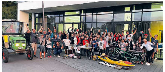
Erster Platz für den Jugendpavillon Öhringen beim kreisweiten Wettbewerb der Jugendräume