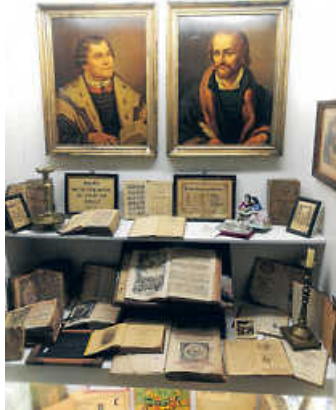
Besuch im Schulmuseum Obersulm-Weiler