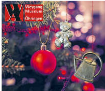
Weihnachtszinngießen am 26. November im Weygang-Museum