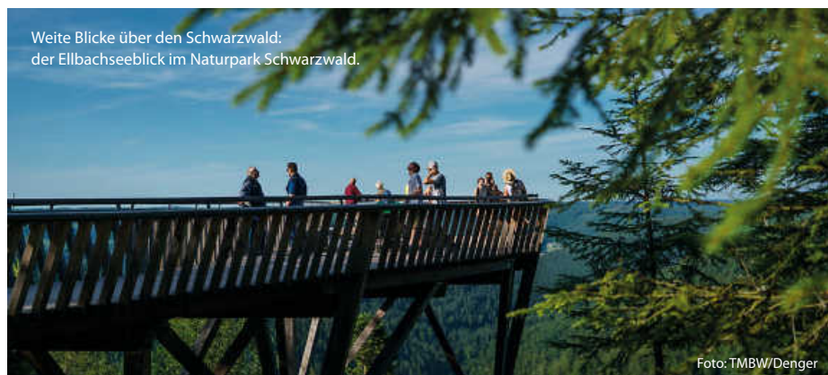
Weite Blicke über den Schwarzwald: der Ellbachseeblick im Naturpark Schwarzwald.

Schon von Weitem ist der Aussichtsturm im Naturpark Schönbuch zu sehen. Die 35 Meter hohe Holz-Stahl-Konstruktion auf dem Stellberg ragt weit über die umliegenden Bäume im ältesten Naturpark Baden-Württembergs hinaus. 348 Stufen erschließen den filigranen Turm und führen zu drei Aussichtsplattformen in 10, 20 und 30 Metern Höhe. Ganz oben kann man nicht nur dem Schönbuch auf sein Blätterdach schauen; auch die Schwäbische Alb und der Schwarzwald erscheinen von hier zum Greifen nah. (TMBW/red)