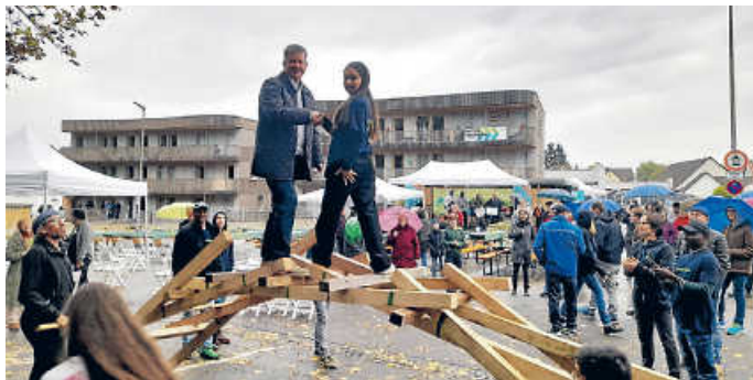
Begegnungen auf der selbst tragenden „Leonardo Brücke“: OB Thilo Michler zusammen mit einer afghanischen Bewohnerin der Hoffnungshäuser, die erfolgreich die 7. Klasse der Realschule absolviert

Die Bewohner gestalten ihr Zusammenleben gemeinsam, unterstützt durch die Standortleitung und Sozialarbeit. Die Hoffnungsträger Stiftung möchte nicht nur Wohnraum schaffen, sondern auch Brücken zwischen den Menschen bauen, um Vorurteile und Ängste abzubauen und echte Beziehungen zu schaffen. Diese Initiative ist ein wichtiger Schritt in Richtung Integration und Gemeinschaft, der zeigt, wie durch offene Türen und offene Herzen Verbindungen zwischen Menschen geschaffen werden können. Seit ihrer Gründung im Jahr 2013 setzt die Hoffnungsträger Stiftung erfolgreich auf ihre Mission, Menschen in Deutschland und weltweit Hoffnung und Perspektiven zu bieten. In Deutschland sind bereits 32 Hoffnungshäuser an 10 Standorten in Baden-Württemberg entstanden, die insgesamt 735 Bewohnerinnen und Bewohner beherbergen. Die Hoffnungsträger Stiftung plant das erfolgreiche Konzept weiter auszubauen, ist dabei jedoch auf die Unterstützung von Fördergeldgebern und Spendern angewiesen.