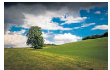
Der Buckelberg in Ohrnberg

Mit dieser jährlichen Pflegemaßnahme legen wir die Grundlage dafür, dass wir im nächsten Frühjahr wieder die reichhaltige Blütenpracht genießen können. Mithelfende sind herzlich willkommen. Damit wir gut ausgestattet sind, bitten wir jeden Helfer Arbeitsutensilien wie Motorsense, Rechen und Heugabel selbst mitzubringen. Auf zahlreiche Mithelferinnen und Mithelfer freuen sich die Vertreterinnen und Vertreter des Ohrnberger Ortschaftsrates.