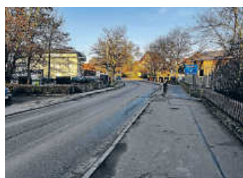
Die Ortsdurchfahrt Cappel wird nächstes Jahr 1,5 Jahre lang saniert. Hier: die marode Brücke über den Epbach

Im ersten Schritt der Sanierungsarbeiten wird die Epbach-Brücke abgerissen und komplett erneuert. Dabei entsteht zunächst eine neue Fuß- und Radwegbrücke neben der alten Epbach-Brücke. Danach wird stadteinwärts die Fahrbahn gesperrt. Stadtauswärts können die Autos während der Bauzeit die neue einspurige Rad- und Fußwegbrücke nutzen. Fernverkehr wird weiträumig umgeleitet. Wenn der neue Fahrbahnbelag im Herbst 2025 verlegt wird, muss die gesamte Straße für ca. vier Wochen voll gesperrt werden. Dann ist leider eine weiträumige Umfahrung notwendig. Alle Zeitangaben stehen unter Vorbehalt.