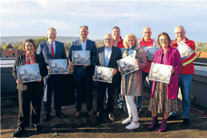
Der Hohenloher Adventskalender 2023 ist wieder da