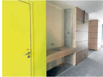
Innenansicht Flur mit Waschtisch