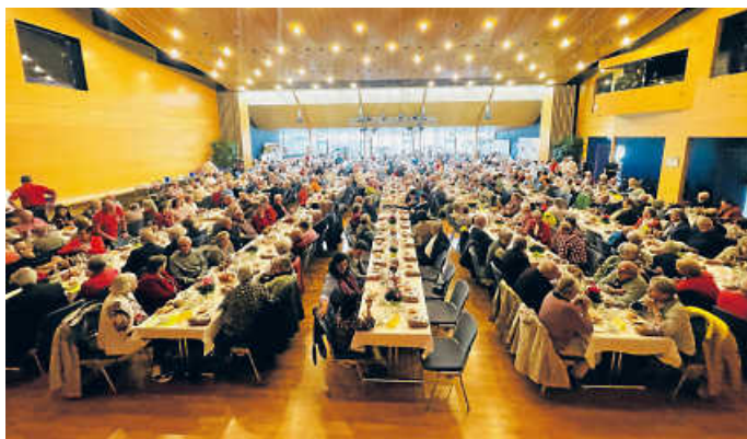
Voller KULTURa-Saal: 522 Karten wurden für die Seniorenfeier 2023 ausgegeben

Der Stadtseniorenrat stellte sein neues Mobilitätsprojekt, die E-Rikscha, vor