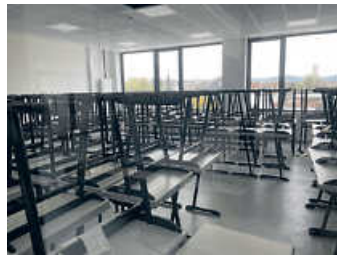
Bereit für den Einzug im April 2024: Mobilier im Klassenzimmer

Das Hohenlohe-Gymnasium Öhringen (kurz: HGÖ) ist das allgemeinbildende Gymnasium der Großen Kreisstadt Öhringen mit einem naturwissenschaftlichen und einem sprachlichen Profil. Es wurde um 1545 gegründet. 2022 unterrichten rund 90 Lehrkräfte 1.217 Schülerinnen und Schüler. Damit ist die Schule eine der größten im Bereich des Regierungspräsidiums Stuttgart. Der Einzugsbereich erstreckt sich weit über die Stadtgrenzen auf den gesamten Hohenlohekreis.