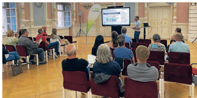
Energie-Erstberatung für Bürgerinnen und Bürger im Öhringer Rathaus

Beratungsoffensive in Öhringen geht in die dritte Runde