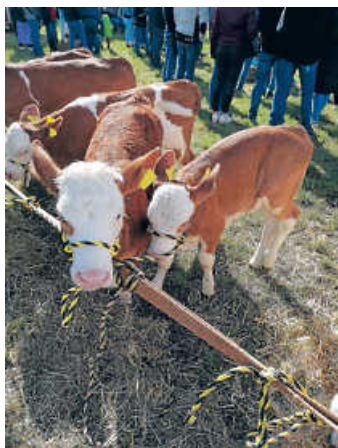
Auch Kälbervorführungen gab es am Aktionstag

Ein vielfältiges Essensangebot rundete den Tag ab.